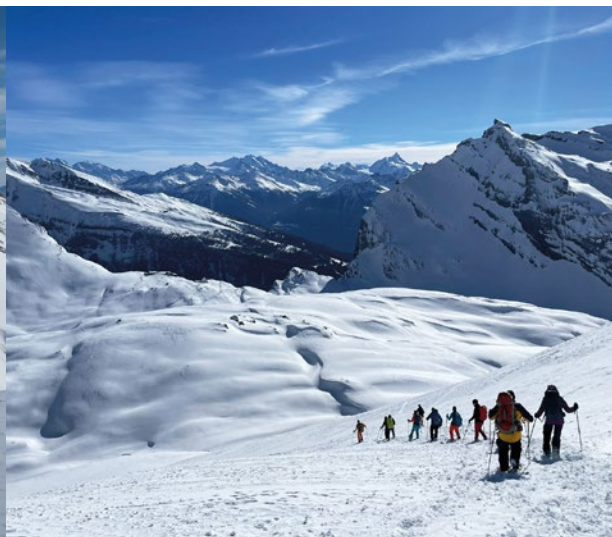
Valserhorn - 📍 Manuel Pellanda