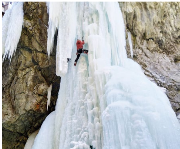
Pontresina - Cascate di ghiaccio - 📍 Thomas Arn