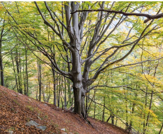
Maggio - Monte San Giorgio - 📍 Marco Volken