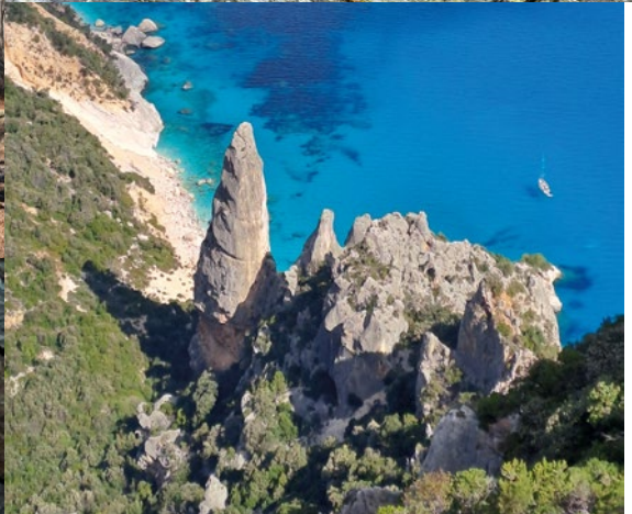
Sopra: Undertalstock - 📍 Fredi Joss Geologia - 📍 Marco Volken Selvaggio Blu - 📍 ▲ Fabio Villa