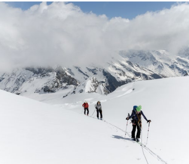
Mont Velan