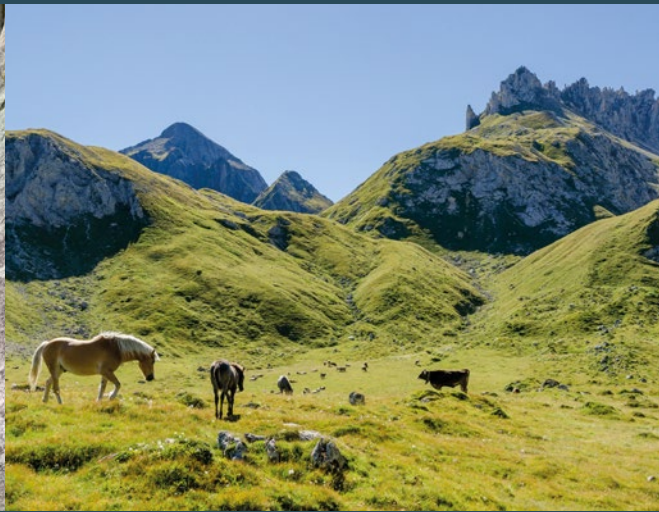
Giugno - Passo Colombe - 📍 Marco Volken

Dent Blanche - 📍 Marco Volken Nepali Highway - 📍 Marco Volken