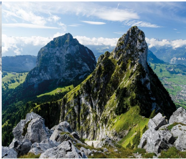
Gross Mythen - 📍 Marco Volken