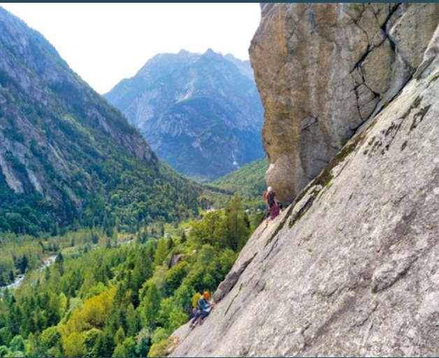
Giugno - Val di Mello - 📍 Andrea Ghidotti

Dent Blanche - 📍 Marco Volken Nepali Highway - 📍 Marco Volken