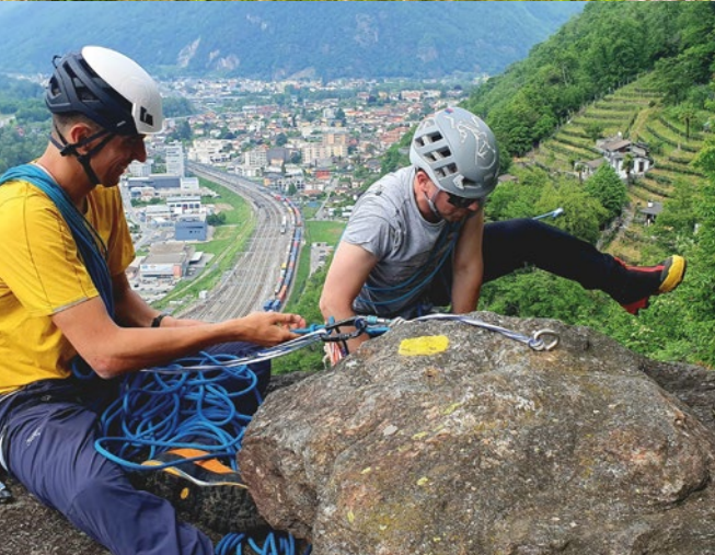
Gole della Breggia - 📍 Marco Volken San Paolo Bellinzona - 📍 Enrico Zamboni